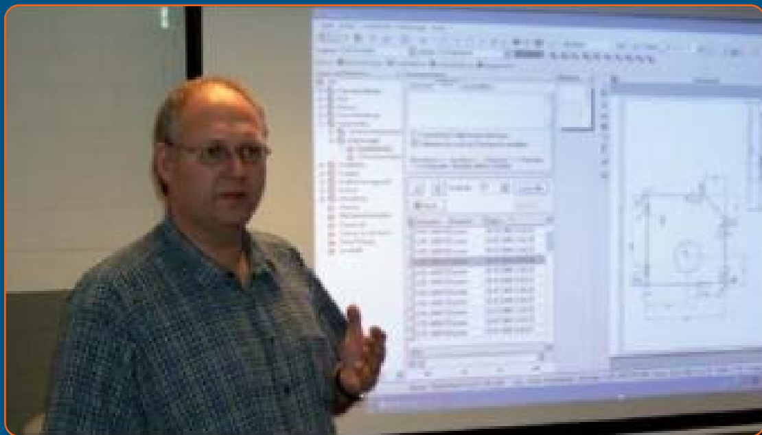
BILD: : DMS-MITARBEITERSCHULUNG BEI ROSINK