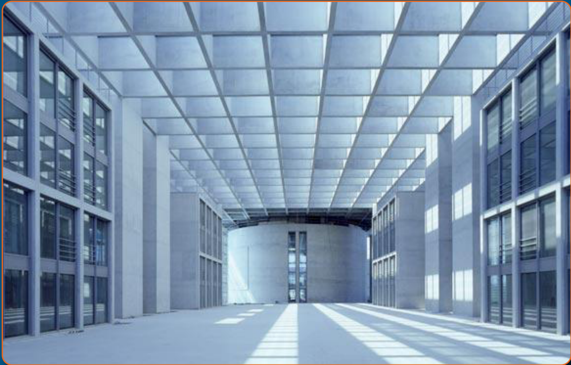
BILD: MARIE-ELISABETH-LÜDERS-HAUS, BERLIN

Ein Mitarbeiter von Stephan Braunfels Architekten wurde speziell geschult, um beispielsweise bei Beginn eines neuen Bauprojektes entsprechende neue Kategorien mit dem grafischen DMS-Administratorbereich selbstständig anlegen zu können. Die Schulung der Mitarbeiter wurde größtenteils von eigenen Kräften durchgeführt, so dass vor Ort lediglich für drei Tage ein Mitarbeiter von bitfarm benötigt wurde.