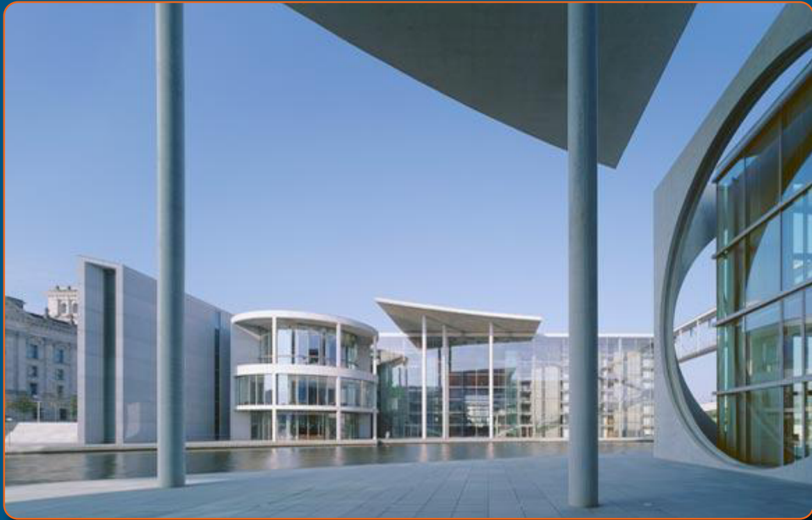
BILD: ABGEORDNETENHAUS DES DEUTSCHEN BUNDESTAGES PAULLÖBE-HAUS, BERLIN

Das Architekturbüro Stephan Braunfels mit Niederlassungen in Berlin und München bearbeitet mittlere bis große Projekte für öffentliche und private Bauherren in Deutschland und weltweit. Dabei entstehen im Verlauf eines Projektes – z.B. Deutscher Bundestag in Berlin – oftmals 500 Aktenordner mit Schriftverkehr, Protokollen und Plänen.