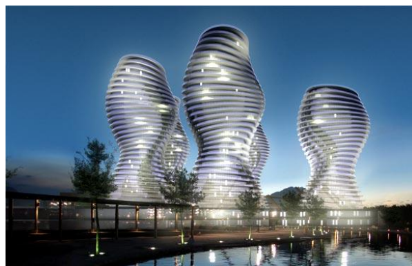
Bild: Entwurf Santa-Lucia-Türme, Mexiko (Quelle: Stephan Braunfels Architekten)

Johannes Hanf, Dipl.-Architekt, ist bei Stephan Braunfels federführend für das DMS-Projekt zuständig. „Nachdem wir verschiedene DM-Systeme getestet hatten, haben wir uns ganz bewusst für die Software von bitfarm entschieden. Zum einen war die Bedienung und die Gestaltung der Oberfläche einfach und übersichtlich – die Software fast selbsterklärend. Zum anderen ermöglichte der modulare Aufbau der Software eine optimale Anpassung an die Bedürfnisse unseres Büros. Eine weitere wichtige Komponente für die Entscheidung für die bitfarm-Software war die Art der Lizenzierung. Wir mussten nicht für ein teures Produkt ohne Support bezahlen. Stattdessen werden die Aufwendungen direkt für den Service durch bitfarm genutzt.“