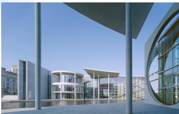
Bild: Abgeordnetenhaus des deutschen Bundestages Paul-Löbe-Haus, Berlin

Das Architekturbüro Stephan Braunfels mit Niederlassungen in Berlin und München bearbeitet mittlere bis große Projekte für öffentliche und private Bauherren in Deutschland und weltweit. Dabei entstehen im Verlauf eines Projektes – z.B. Deutscher Bundestag in Berlin – oftmals 500 Aktenordner mit Schriftverkehr, Protokollen und Plänen.