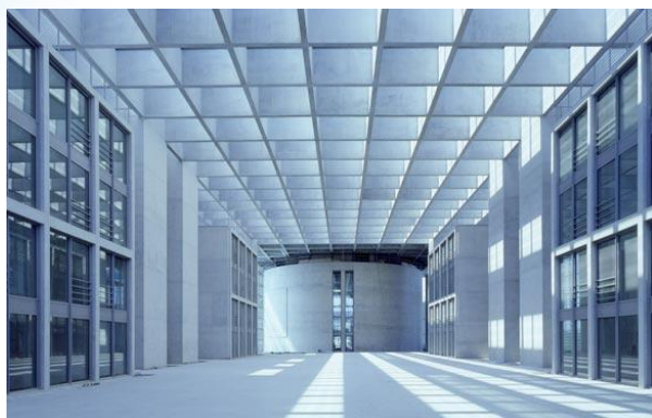
Bild: Marie-Elisabeth-Lüders-Haus, Berlin

Ein Mitarbeiter von Stephan Braunfels Architekten wurde speziell geschult, um beispielsweise bei Beginn eines neuen Bauprojektes entsprechende neue Kategorien mit dem grafischen DMS-Administratortool selbstständig anlegen zu können. Die Schulung der Mitarbeiter wurde größtenteils von eigenen Kräften durchgeführt, so dass vor Ort lediglich für drei Tage ein Mitarbeiter von bitfarm benötigt wurde.